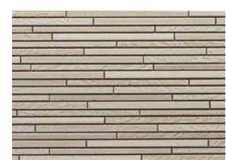
STBY5SYFE スティックアイボリーFE