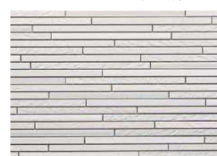
STBY5SWFE スティックホワイトFE