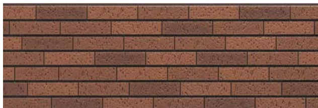
TRY5TGFE トラシナオレンジブラウンFE

●サイズ: 15×455×3,030mm ●梱包: 2枚 ●重量 (1枚): 約24kg