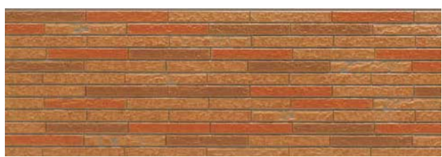
EMY5EORFE エモーネオレンジFE

シーリング レス工法 セルファッ素 コート EXE 30 セルファッ素 コート EXE セルファッ素 コート plus 塗膜の 変色・褪色 20年保証