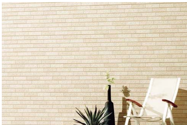
セルフッ素 plus ▶ P.126