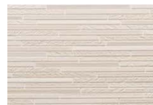
STBY5SRFE スティックライトグレーFE