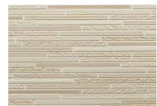
STBY5SUFE スティックグレーベージュFE