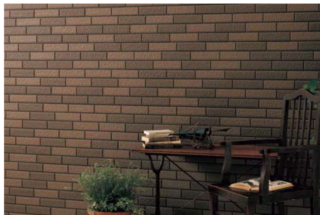
セルフッ素 plus ▶ P.127

均整のとれた意匠が住まいに優雅さと高級感を与えるタイル柄。重厚感あふれる趣をセルフッ素コート・EXEで長持ち。