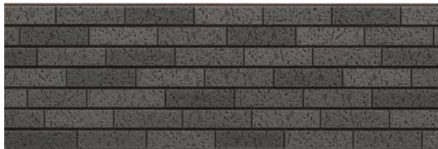
TRY5TKFE トラシナブラックFE