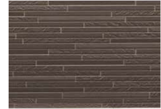
STBY5SMFE スティックダークブラウンFE