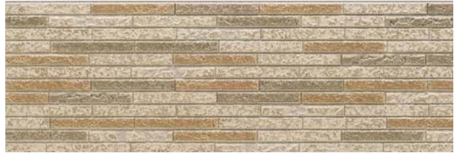
EMY5EBGFE エモーネベージュFE

EMY5 カラー 8,400円/1枚 (6,093円/㎡) ●サイズ: 15×455×3,030mm ●梱包: 2枚 ●重量 (1枚): 約24kg