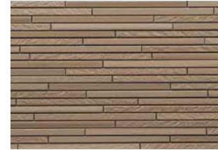
STBY5SCFE スティックシナモンFE

STBY5 カラー 8,400円/1枚 (6,093円/m 2 ) ●サイズ: 15×455×3,030mm ●梱包: 2枚 ●重量 (1枚): 約24kg