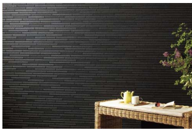
セルファッ素 plus ▶ P.119

割石とフラットの2種類のテクスチャーが混じり合ったボーダータイル。 シンプルな現代風のスタイルに最適です。