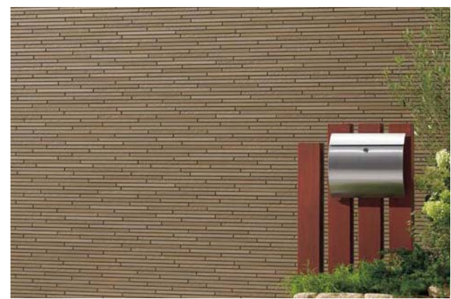
セルファッ素 plus ▶ P.120

シンプルなボーダータイル柄で深くシャープな表情が、すっきりとした印象を与えます。連棟の張り分け展開にも最適な淡色、中濃色、濃色と幅広い色揃えとしています。