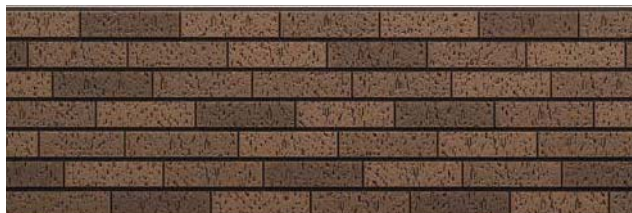
TRY5TRFE トラシナブラウンFE