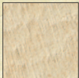
ブライムアイボリー[PI]

まるでモルディブリゾートのような 非日常的な空間が与えてくれる安らぎ。 時の経過を忘れさせてくれます。