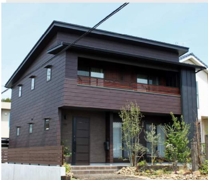
関市の家（岐阜県）カラーGL 鋼板 Cs 型