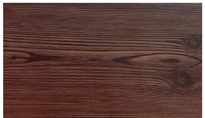
焼杉（ガルバリウム鋼板 板厚 0.35mm）標準材料

本社/〒578-0904 東大阪市吉原2丁目4番41号 TEL (072) 968-1200(代) FAX (072) 968-1212 東京営業所/〒331-0804 埼玉県さいたま市北区土呂町2丁目44-9 TEL (048) 662-1234 FAX (048) 662-1212